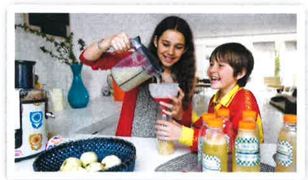
Een eigen voedselabriek

Voor dit thema zijn we op zoek naar allerlei spullen die betrekking hebben op duurzaamheid. Denk aan biologische en gerecyclede producten. We kunnen deze spullen gebruiken in de lessen of neerleggen op onze thematafel.