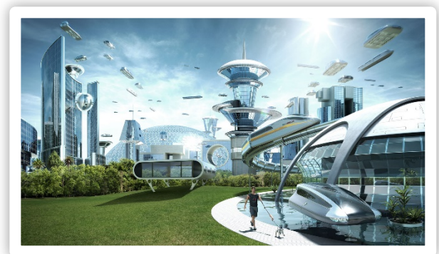
Wordt dit de stad van de toekomst?