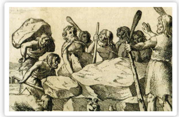
Het raadsel van de hunebedden – hoe werden ze gebouwd?